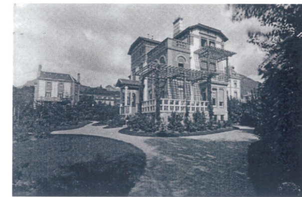
Villa Dubochet No. 8, peu après son achèvement env. 1880

Sœurs des chalets de villégiature commandés par Napoléon III à Vichy, du lotissement résidentiel dans un parc à l'anglaise du Vésinet près de Paris, les villas Dubochet forment en 1874 l'une des premières cités-jardins. C'est Alphand, auteur des "Promenades de Paris", directeur des travaux de Paris sous Hausmann, qui conçoit les villas Dubochet, dessinant simultanément le plan du quartier, ses allées et clôtures, haies de cloisonnement, jardins et villas. Cité-jardin, c'est à dire individualité et invention de chaque villa et de son jardin qui en est l'écrin et composantes communes qui assurent l'image d'ensemble du quartier, son identité. Qu'est-ce qui participe de l'ensemble, qui garantit la reconnaissance de cet ensemble ? Qu'est-ce qui est dans la liberté inventive du caractère de chaque villa ? Mais toujours cette règle : jardin et villa relèvent d'une même continuité, d'une même expression, d'un même soin.