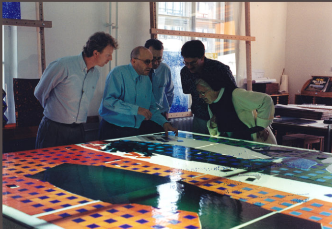
Visite en 1996 à l'atelier Mayer Hofkunstanstalt à München